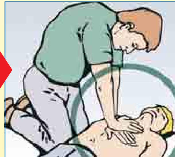
30x Herzdruckmassage Hände in Brustmitte Drucktiefe 4-5 cm Arbeitstempo 100/min