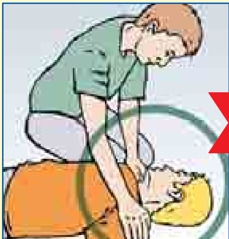
Bewusstsein prüfen laut ansprechen, anfassen, rütteln