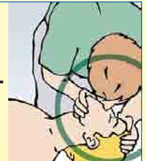
2x Beatmung 1 sec lang Luft in Mund oder Nase einblasen