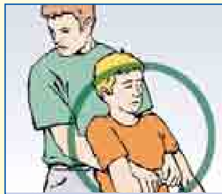
Person ggf. aus dem Gefahrbereich retten