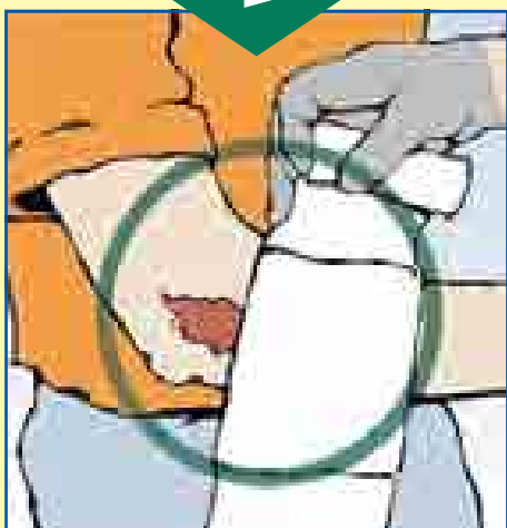
Situationsgerecht helfen z. B. Wunde versorgen